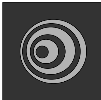
Figure 4. Aspect d'une étoile avec une mauvaise collimation.