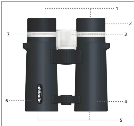
Figure 1. Description des différentes parties.

Félicitations pour l'achat de la nouvelle série de jumelles Omegon Talron. Ce sont des jumelles haute-résolution jusqu'en bord de champ pour une meilleure performance, au meilleur prix. Les verres spéciaux et le traitement multicouche sont utilisés pour offrir le meilleur rendu de couleurs et de piqué d'image. L'intérieur des jumelles est rempli à l'azote sous vide pour empêcher la condensation. Elles sont également étanches.