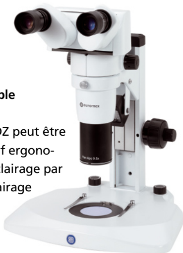
DZ.1800 avec tête ergonomique

La tête de la série DZ peut être montée sur un statif ergonomique doté d'un éclairage par incidence et un éclairage par transmission à diodes électroluminescentes (LED) et avec intensités lumineuses réglables