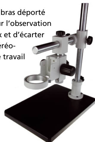
DZ.5020 Statif universel sans éclairage

Le statif universel à bras déporté permet à l'opérateur l'observation d'objets volumineux et d'écarter au besoin la tête stéréoscopique de plan de travail